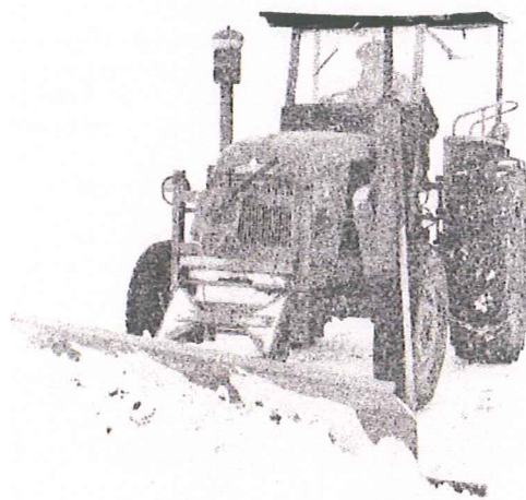
Modèle 1965 sur RENAULT N 51